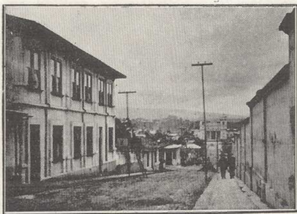
San José. — La iglesia de la Soledad

Todos los chicos y el maestro se admiraron grandemente y comenzaron á preocuparse del sietemesino , como le llamaban.