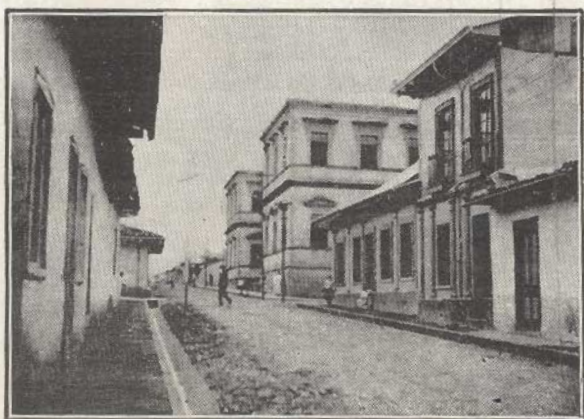
San José. Edificio del Colegio Superior de Señoritas

El amor, pensaba yo, es más fuerte que la muerte y que el miedo de morir. Sólo por el amor se mueve y se mantiene la vida.